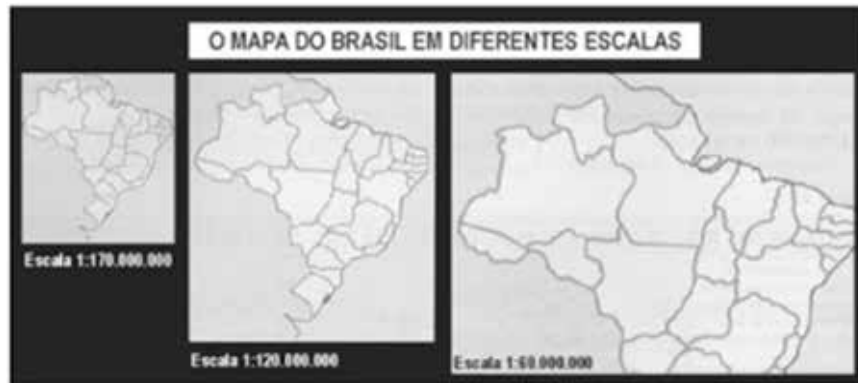
Figura: Mapa do Brasil em diferentes escalas.

Obs.: ESCALAS (1: 170.000.000) (1: 120.000.000) (1: 60.000.000)